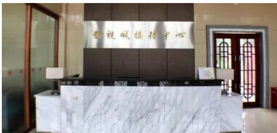
國藝度假酒店接待中大堂