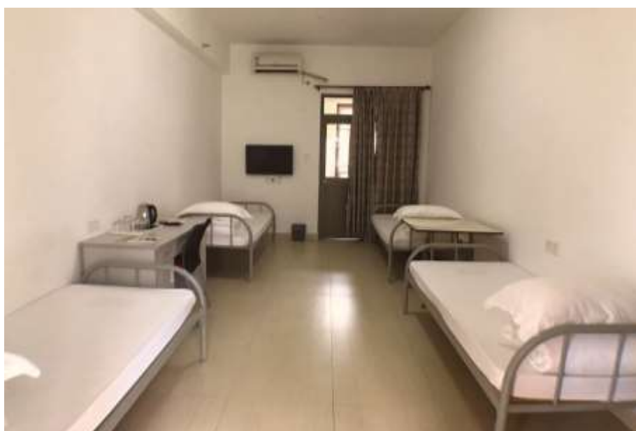
國藝度假酒店接待中心四床房