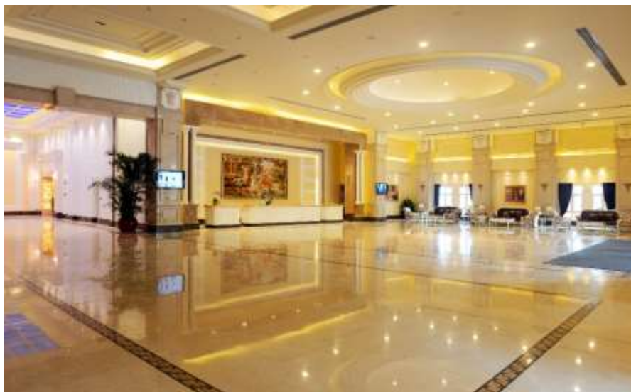
國藝度假酒店大堂