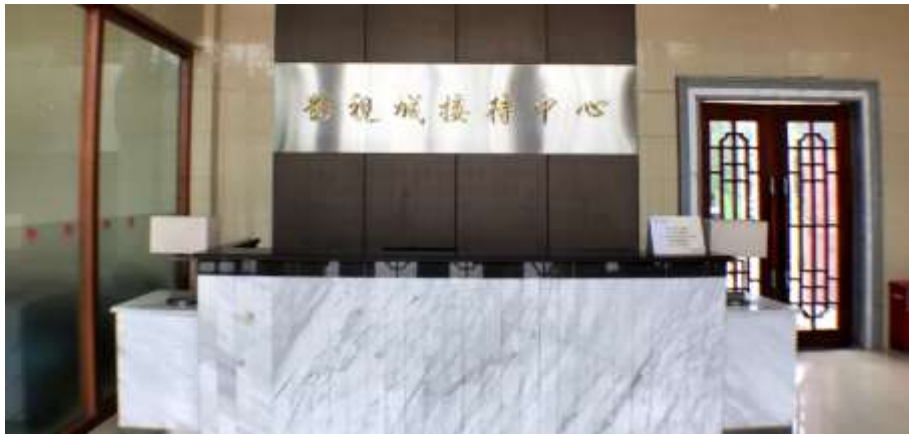
國藝度假酒店接待中大堂