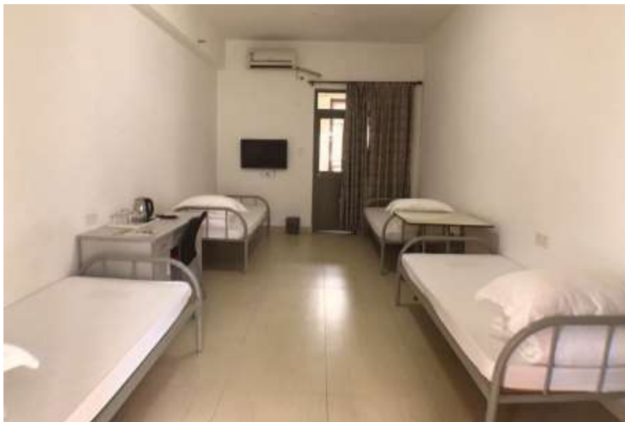
國藝度假酒店接待中心四床房